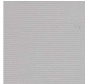
LITE-0604 ✗ Grigio chiaro