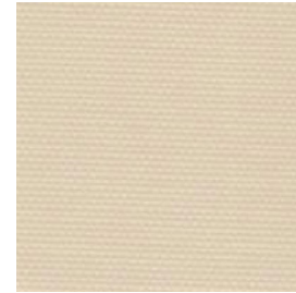
LITE-0603 ✗ Crema