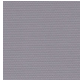
LITE-0605 ✗ Grigio scuro