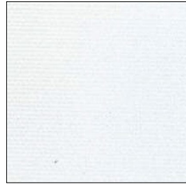
LITE-0601 ✗ Bianco