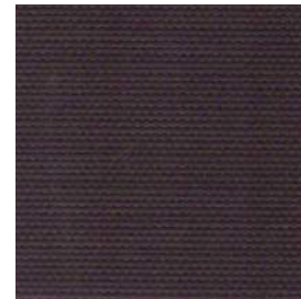
LITE-0606 ✗ Nero